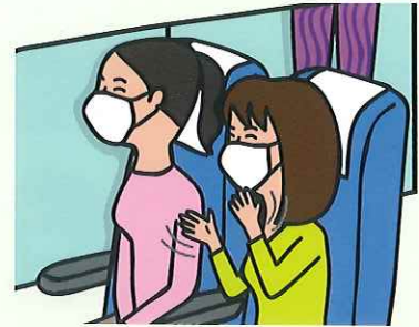
通常通り座席をご使用いただけます