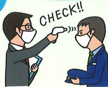
乗務員の体温をチェックしています