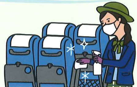
車内の消毒を徹底しています