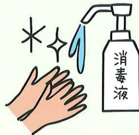
乗車時に消毒をお願いします